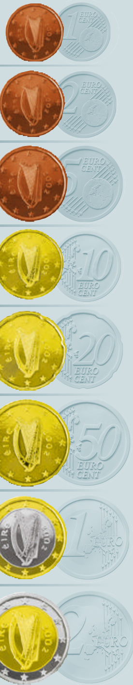
Όλα τα κέρματα απεικονίζουν την κέλτικη άρπα, παραδοσιακό σύμβολο της Ιρλανδίας.

Το κοινό δεν προβλέπεται να προεφοδιαστεί με τραπεζογραμμάτια ή κέρματα ευρώ.