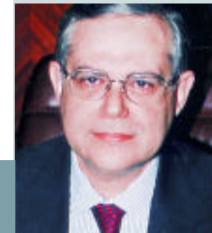
Λουκάς Παπαδήμος Διοικητής της Τράπεζας της Ελλάδος

Οι απαραίτητες ενέργειες για την εισαγωγή του ευρώ σε φυσική μορφή έχουν ήδη αρχίσει: Συντονισμένες προσπάθειες καταβάλλονται στα εκτυπωτικά ιδρύματα και νομισματοκοπεία στις χώρες της ζώνης του ευρώ, τα οποία έχουν αναλάβει την παραγωγή των τραπεζογραμμμάτων και κερμάτων του ενιαίου νομίσματος. Αλλά και οι φορείς και οι υπηρεσίες που θα αναλάβουν την αποθήκευση, διανομή και εισαγωγή στην κυκλοφορία του νέου νομίσματος, θα επωμισθούν τεράστια ευθύνη για τον ομαλό εφοδιασμό της αγοράς. Εκτιμάται ότι στην Ελλάδα θα αποσυρθούν περίπου 700 εκατομμύρια τεμάχια τραπεζογραμμμάτων και 7 χιλιάδες τόνοι κερμάτων δραχμών, ενώ στο τέλος του 2001 θα είναι δια-