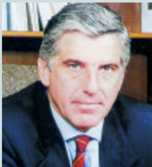
Γιάννος Παπαντωνίου Υπουργός Εθνικής Οικονομίας και Οικονομικών