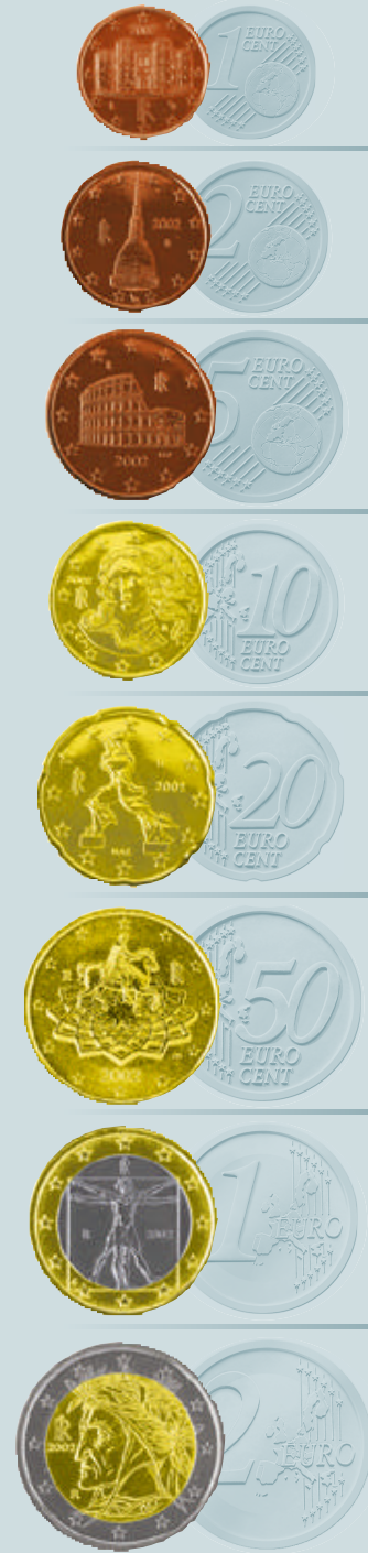
Στο κέρμα των 2 ευρώ τιμάται ο μεγάλος ποιητής Δάντης, στο κέρμα του 1 ευρώ απεικονίζεται το περίφημο σχέδιο του Λεονάρντο ντα Βίντσι, ενώ για τις όψεις των μικρότερων κερμάτων επιλέχθηκαν ο Μάρκος Αυρήλιος, το γλυπτό «το Σύμβολο» του Ου. Μποτσιόνι, τμήμα από τη «Γέννηση της Αφροδίτης» του Σ. Μποττιτσέλλι, το Κολοσσαίο της Ρώμης, ο πύργος της Mole Antoniana και το Castel del Monte.

Αντίστοιχα, η Τράπεζα της Ελλάδος και το Υπουργείο Οικονομικών προχώρησαν σε εξειδίκευση της διαδικασίας απόσυρσης των κερμάτων, καθώς και σε λεπτομερή σχεδιασμό των τρόπων παραλαβής, αποθήκευσης και καταστροφής των αποσυρόμενων κερμάτων. Ειδικότερα, αυτό θα υλοποιηθεί με τη χρήση ακυρωτικών μηχανημάτων που θα εγκατασταθούν σε Υποκαταστήματα της Τράπεζας της Ελλάδος, ενώ η μεταφορά και η απόσυρση του υλικού θα πραγματοποιηθούν μέσω του Οργανισμού Διαχείρισης Δημοσίου Υλικού.