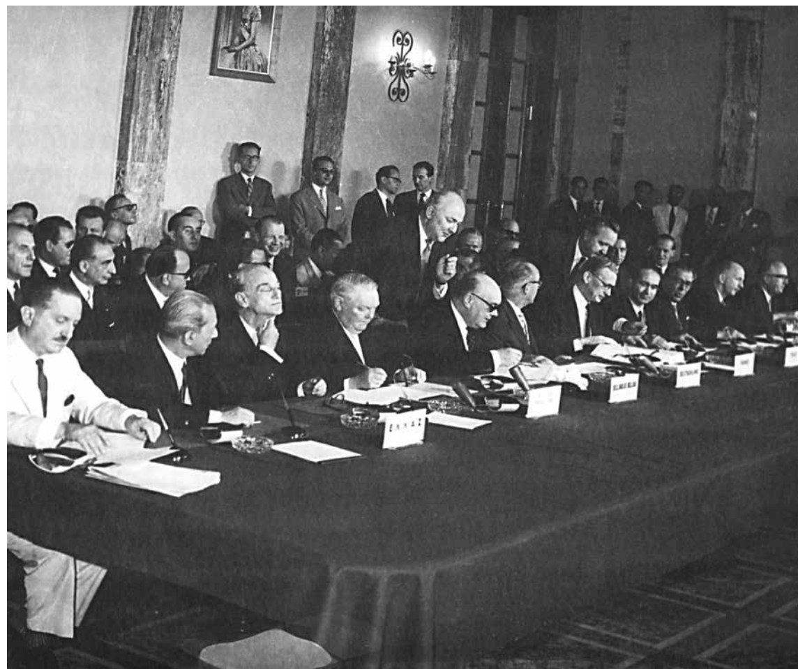
Εικ. 19. Αθήνα, 9 Ιουλίου 1961, κατά την υπογραφή της Συμφωνίας Σύνδεσης. Από αριστερά κάθονται ο Υπουργός Εξωτερικών Ευάγ. Αβέρωφ-Τοσίτσας, ο Υπουργός Συντονισμού Α. Πρωτοπαπαδάκης, ο Αντιπρόεδρος της Κυβέρνησης Π. Κανελλόπουλος, ο Γερμανός Αντικαγκελάριος και Υπουργός Οικονομικών Ludwig Erhard, ο Βέλγος Αντιπρόεδρος της Κυβέρνησης και Υπουργός Εξωτερικών P. Henri-Spaak, ο Γερμανός Πρέσβης Gunther Seeliger, ο Βέλγος Υπουργός Εξωτερικών Jacques-Maurice Couve de Murville, ο Ιταλός Υπουργός Βιομηχανίας και Εμπορίου Emilio Colombo, ο Υπουργός Εξωτερικών του Λουξεμβούργου Eugène Schaus, ο Ολλανδός Υφυπουργός Εξωτερικών Hans Van Houten και ο Πρόεδρος της Επιτροπής Walter Hallstein.

Φρονούμεν πράγματι ότι τοιουτοτρόπως επελέγη η καλύτερα οδός προς επίτευξιν όλων των αντικειμενικών σκοπών τους οποίους είχομεν θέσει εις εαυτούς, δηλαδή να δημιουργήσωμεν ευνοϊκάς συνθήκας