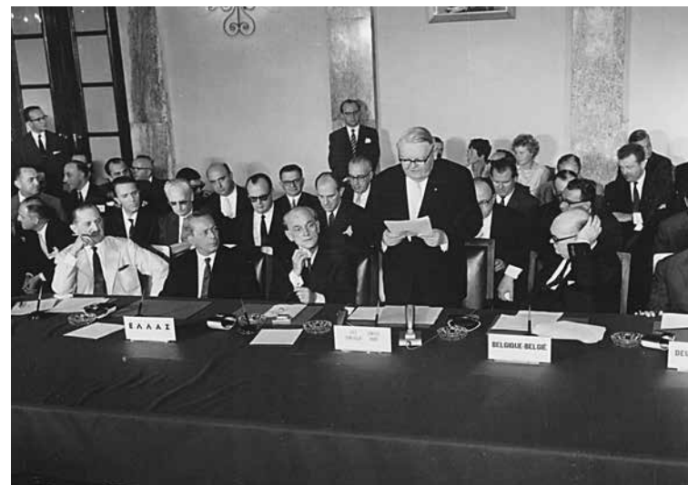
Εικ. 20. Ο Γερμανός Αντικαγκελάριος και Υπουργός Οικονομικών Ludwig Erhard εκφωνεί την ομιλία του στη διάρκεια της τελετής υπογραφής της Συμφωνίας Σύνδεσης, Αθήνα, 9 Ιουλίου 1961.

Η γενική διάρθρωσις της Συμφωνίας Συνδέσεως δέον να εξετασθή εν συναρτήσει προς τους ανωτέρω γενικούς αντικειμενικούς σκοπούς.