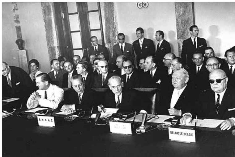
Εικ. 4. Αθήνα, 9 Ιουλίου 1961, κατά την υπογραφή της Συμφωνίας Σύνδεσης. Από αριστερά κάθονται ο Υπουργός Εξωτερικών Ευάγ. Αβέρωφ-Τοσίτσας, ο Υπουργός Συντονισμού Α. Πρωτοπαπαδάκης, ο Αντιπρόεδρος της Κυβέρνησης Π. Κανελλόπουλος, ο Γερμανός Αντικαγκελάριος και Υπουργός Οικονομικών L. Erhard και ο Βέλγος Αντιπρόεδρος της Κυβέρνησης και Υπουργός Εξωτερικών P. Henri-Spraak. Από πίσω τους, εκατέρωθεν του Ι. Πεσμαζόγλου, διακρίνονται ο μόνιμος Αντιπρόσωπος της Ελλάδας στην ΕΟΚ Θ. Χρηστίδης (αριστερά) και ο Γενικός Διευθυντής του Υπουργείου Συντονισμού και στενός συνεργάτης του Πρωθυπουργού σε οικονομικά θέματα Ι. Λαμπρούκος (δεξιά). Πηγή: ΙΑΤΕ – Αρχείο Πεσμαζόγλου, Α6-S15-Y3-F3-T25.

Παρά ταύτα, οι Ιταλοί επανήλθαν τον Δεκέμβριο, ζητώντας επέκταση του πρωτοκόλλου για τα ελληνικά εσπεριδοειδή στα ροδάκινα και τις νωπές σταφίδες. Η ελληνική πλευρά αντιπρότεινε την προσθήκη των ροδάκινων, όχι όμως των σταφυλιών, ενώ έθεσε ως ποσοτική αφετηρία τούς 40.000 τόνους, έναντι των ιταλικών προτάσεων για 35.000 τόνους (βλ. Τεκμήριο 6.3, σελ. 177). Τα πράγματα ήταν πιο ενθαρρυντικά στο μέτωπο του καπνού όπου, μετά από μήνες συζητήσεων, ανακοινώθηκε στην ελληνική ομάδα η απόφαση του Συμβουλίου των Υπουργών της ΕΟΚ να δεχτεί τη μείωση κατά 50% των δασμών των χωρών-μελών από την έναρξη εφαρμογής της Συνθήκης, με ταυτόχρονη προσαρμογή προς το κοινό δασμολόγιο.