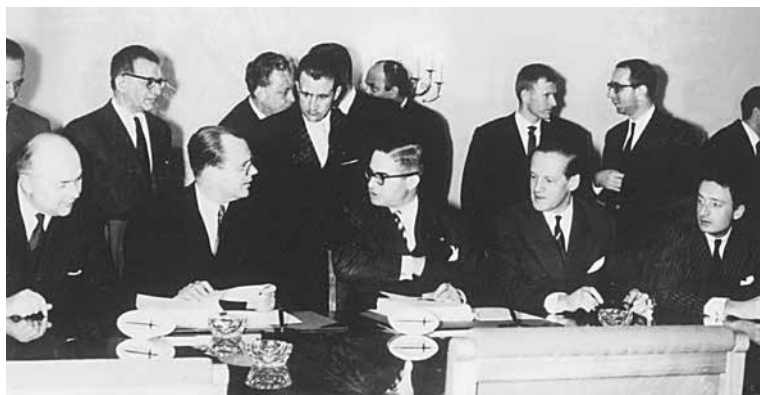
Εικ. 3. Ο Ι. Πεσμαζόγλου συνομιλεί με τον Βέλγο Επίτροπο Εξωτερικών Υποθέσεων και Επικεφαλής της Αντιπροσωπείας της ΕΟΚ Jean Rey· μεταξύ 1959 και 1961, οι δύο άνδρες πέρασαν πάρα πολλές ώρες στο τραπέζι των διαπραγματεύσεων. Το στιγμιότυπο από τη μονογράφηση της Συμφωνίας Σύνδεσης στις Βρυξέλλες την 30ή Μαρτίου 1961. Διακρίνονται: όρθιοι από αριστερά οι Δημ. Μπίμπας, Γεν. Διευθυντής Υπουργείου Οικονομικών, Νικ. Γαζής, Νομικός Σύμβουλος Ελληνικής Αντιπροσωπείας, και καθήμενοι εκατέρωθεν του Ι. Πεσμαζόγλου και του J. Rey από αριστερά οι Αλέξ. Σγουρδαίος, Πρέσβης, και Jean Francois Deniau, Αναπληρωτής Γενικός Διευθυντής Εξωτερικών Σχέσεων ΕΟΚ.

από τους προϋπολογισμούς των Έξι. Αυτό σήμαινε ειδικές προβλέψεις για το ταμείο της Ευρωπαϊκής Τράπεζας Επενδύσεων, που θα παρέκαμπταν την εκκρεμότητα της ρύθμισης του ελληνικού εξωτερικού δημόσιου χρέους, χωρίς όμως να εξασφαλίζουν στην Ελλάδα το σύνολο των κεφαλαίων που διεκδικούσε (βλ. Τεκμήριο 3.2, σελ. 107).