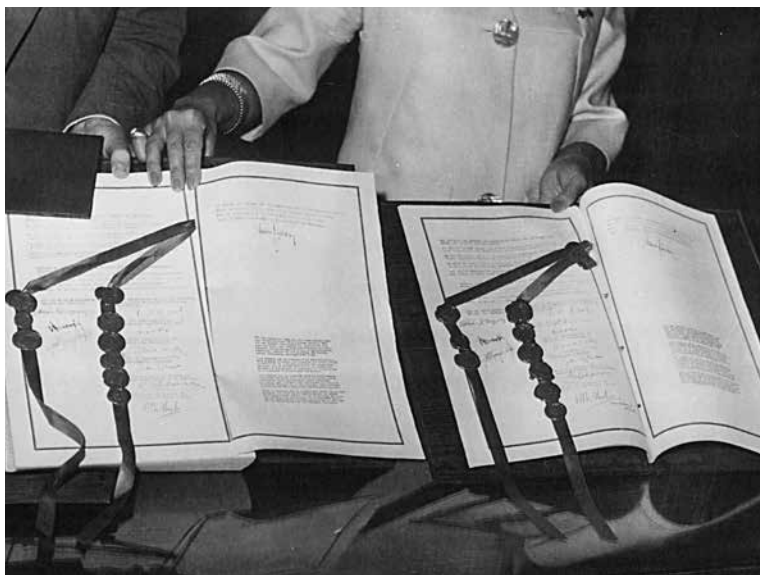
Εικ. 5. Αθήνα, 9 Ιουλίου 1961· το πρωτότυπο κείμενο της Συμφωνίας Σύνδεσης φωτογραφίζεται μετά την υπογραφή του στην αίθουσα τροπαίων του Μεγάρου της Βουλής. Πηγή: ΙΑΤΕ – Αρχείο Πεσμαζόγλου, Α6-S15-Y3-F3-T40.

ελληνικό πνεύμα που είχε κάνει την Ευρώπη μεγάλη, ήθελε να έρθει και να γίνει μέλος. 44