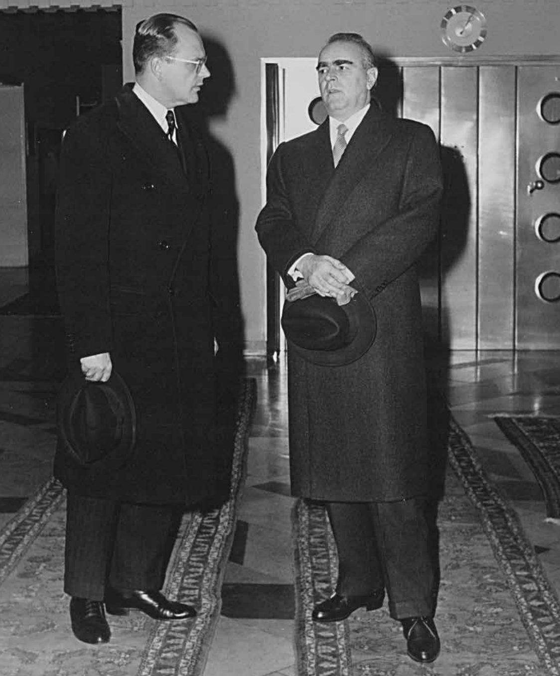
Εικ. 6. Βόννη, 10-13 Νοεμβρίου 1958· ο Ι. Πεσμαζόγλου συνοδεύει τον Πρωθυπουργό Κ. Καραμανλή κατά την επίσημη επίσκεψή του στον Καγκελάριο Κ. Adenauer. Λίγους μήνες αργότερα, η Ελλάδα θα υποβάλει επίσημο αίτημα σύνδεσης με την ΕΟΚ.