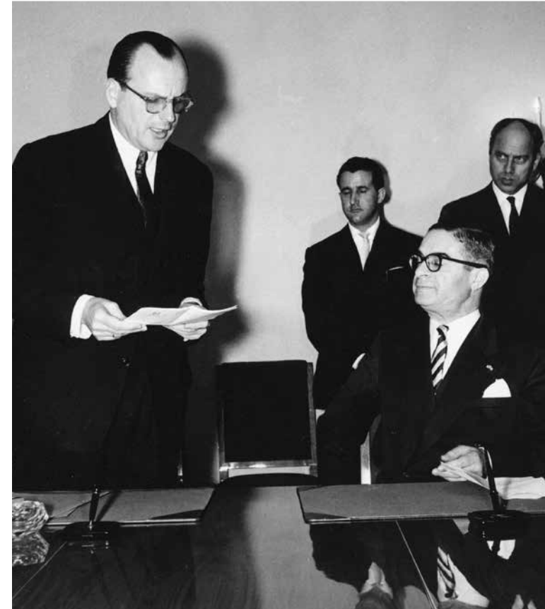
Εικ. 17. Βρυξέλλες, 30 Μαρτίου 1961· ο Ι. Πεσμαζόγλου απευθύνεται στον Jean Rey κατά την τελετή μονογραφής της Συμφωνίας Σύνδεσης.