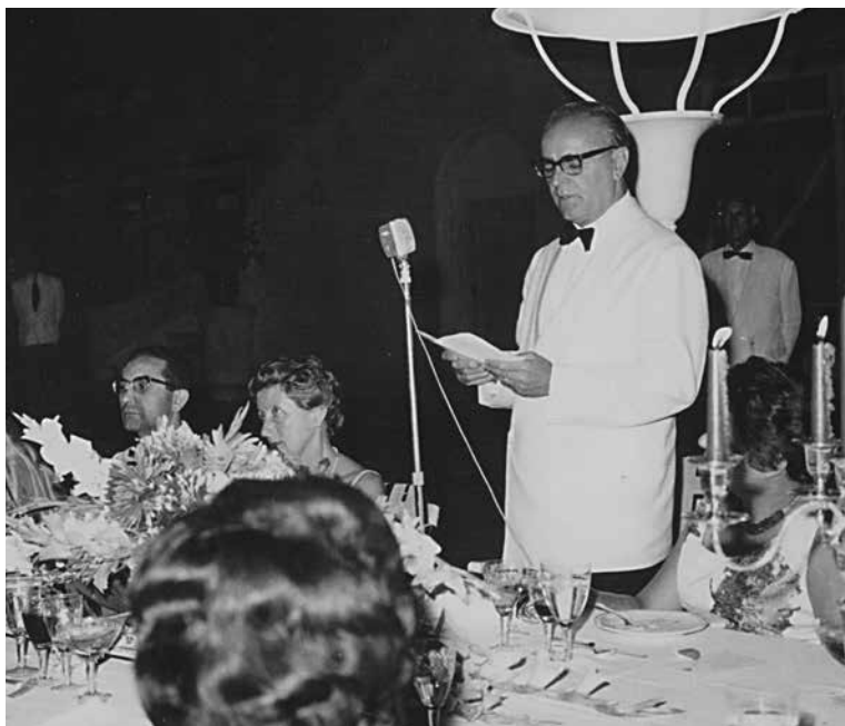
Εικ. 21. Ομιλία του πρωθυπουργού Κ. Καραμανλή στο επίσημο γεύμα που παρατέθηκε στον Ιπλόδρομο μετά την υπογραφή της Συμφωνίας Σύνδεσης, στις 9 Ιουλίου 1961. Δίπλα του κάθονται (από αριστερά) η Μιράντα Πεσμαζόγλου (σύζυγος του Ιωάννη) και ο Ιταλός Υπουργός Βιομηχανίας και Εμπορίου Emilio Colombo.

πεδίων της Συνθήκης της Ρώμης, ως η ελεύθερα κυκλοφορία προσώπων, υπηρεσιών και κεφαλαίων, το δικαίωμα εγκαταστάσεως, οι μεταφορές, οι κανόνες ανταγωνισμού, ο συντονισμός της οικονομικής και εμπορικής πολιτικής, κ.λπ.