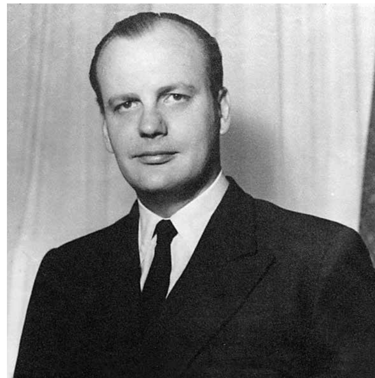
Εικ. 1. Ο Ιωάννης Σ. Πεσμαζόγλου σε φωτογραφία τραβηγμένη στη Νέα Υόρκη το 1953.

Εφοδιασμένος με ένα σπάνιο μείγμα πολιτικού αισθητηρίου, ρεαλισμού και επιστημονικής κατάρτισης, ο Πεσμαζόγλου εργάστηκε άοκνα στα χρόνια που ακολούθησαν για την πιστή εφαρμογή των συμφωνηθέντων της Σύνδεσης. Όμως, η επιβολή της δικτατορίας των συνταγματάρχων ανέτρεψε πλήρως τα δεδομένα. Έκτοτε, ο εξέχων οικονομολόγος συνηγορούσε στην απόφαση των Ευρωπαϊκών Κοινοτήτων για το πάγωμα της Συμφωνίας Σύνδεσης, αξιολογώντας την ως σημαντικό διαπραγματευτικό εργαλείο εναντίον του στρατιωτικού καθεστώτος. Άλλωστε, κατά τη διάρκεια της επταετίας, ο Πεσμαζόγλου ανέπτυξε έντονη αντιδικτατορική δράση, τόσο μέσω της Εταιρείας Μελέτης Ελληνικών Προβλημάτων (ΕΜΕΠ), όσο και μέσω των παρεμβάσεών του και της στήριξης που παρείχε σε μέλη αντιστασιακών