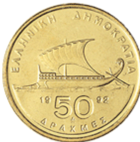
ΑΡΧΑΪΚΟ ΕΛΛΗΝΙΚΟ ΠΛΟΙΟ