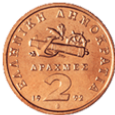
ΝΑΥΤΙΚΟ ΣΥΜΒΟΛΟ ΤΟΥ 1821