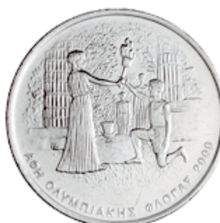
ΑΦΗ ΟΛΥΜΠΙΑΚΗΣ ΦΛΟΓΑΣ