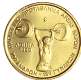
ΑΓΩΝΙΣΜΑ ΑΡΣΗΣ ΒΑΡΩΝ