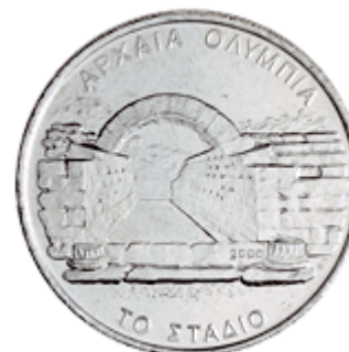
ΑΡΧΑΙΑ ΟΛΥΜΠΙΑ ΤΟ ΣΤΑΔΙΟ