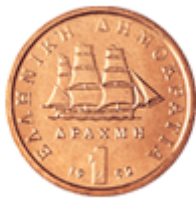
ΠΛΟΙΟ ΤΟΥ 1821 "ΚΟΡΒΕΤΑ"