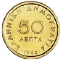
50 ΛΕΠΤΑ ΕΛΛΗΝΙΚΗ ΔΗΜΟΚΡΑΤΙΑ