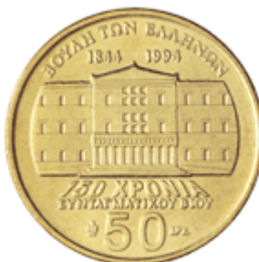
ΒΟΥΛΗ ΤΩΝ ΕΛΛΗΝΩΝ