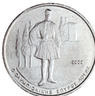
Ο ΟΛΥΜΠΙΟΝΙΚΗΣ ΣΠΥΡΟΣ ΛΟΥΗΣ