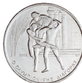
Ο ΟΛΥΜΠΙΟΝΙΚΗΣ ΔΙΑΓΟΡΑΣ