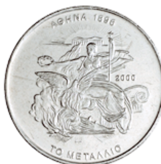
ΤΟ ΜΕΤΑΛΛΙΟ 1896