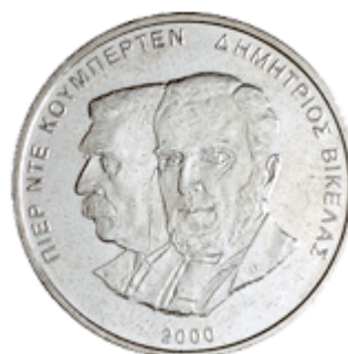
ΠΙΕΡ ΝΤΕ ΚΟΥΜΠΕΡΤΕΝ ΔΗΜΗΤΡΙΟΣ ΒΙΚΕΛΑΣ