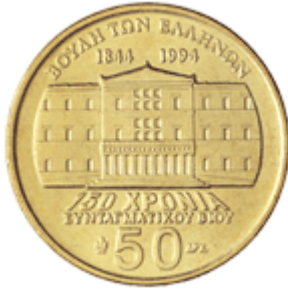
ΒΟΥΛΗ ΤΩΝ ΕΛΛΗΝΩΝ